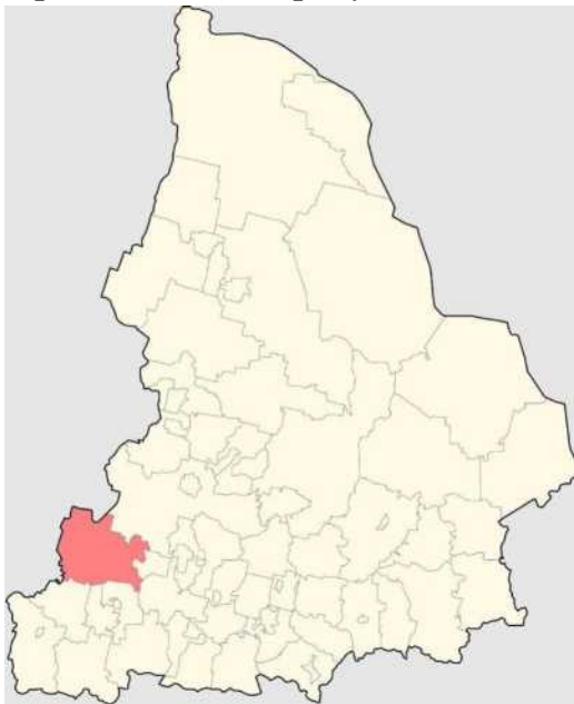
Рисунок 1. Месторасположение Шалинского муниципального округа в пределах Свердловской области

Шалинский городской округ расположен в юго-западной части Свердловской области, граничит с Горноуральским, Первоуральским и Ачитским городскими округами, Нижнесергинским муниципальным районом и городским округом Староуткинск, относится к Западному управленческому округу. Городской округ расположен на западе Свердловской области в 150 км северо-западнее областного центра - г. Екатеринбург. Местоположение Шалинского муниципального округа в пределах Свердловской области представлено на рисунке 1.